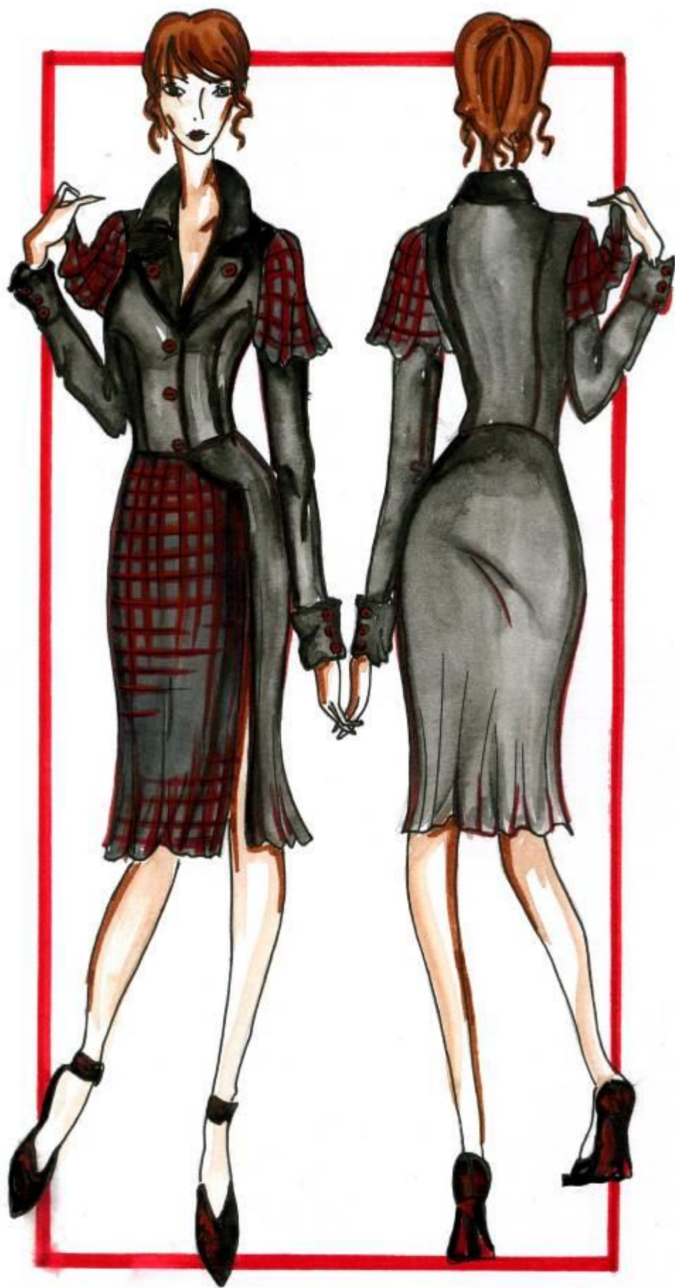
Модель № 1