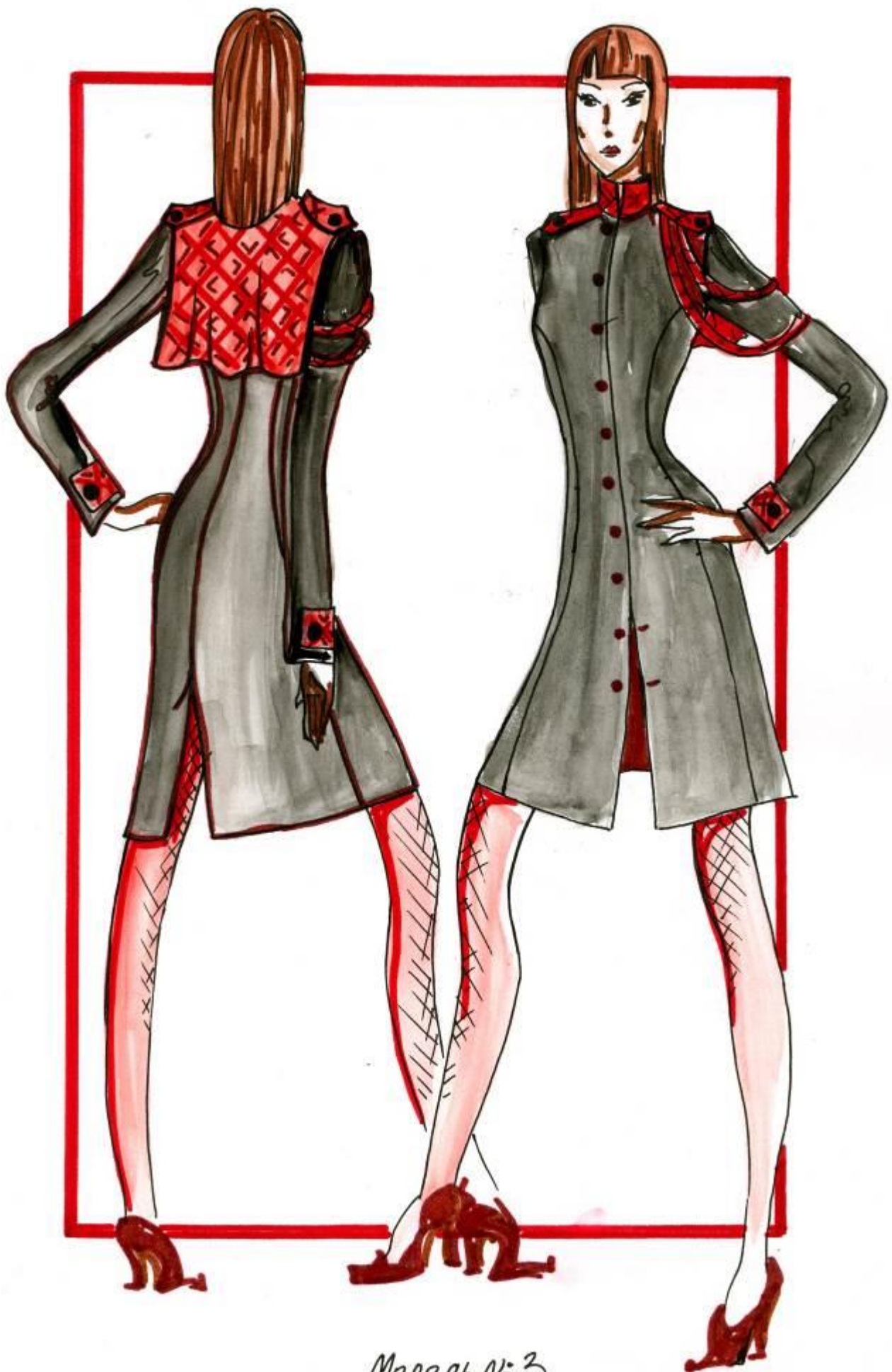
Модель № 3.