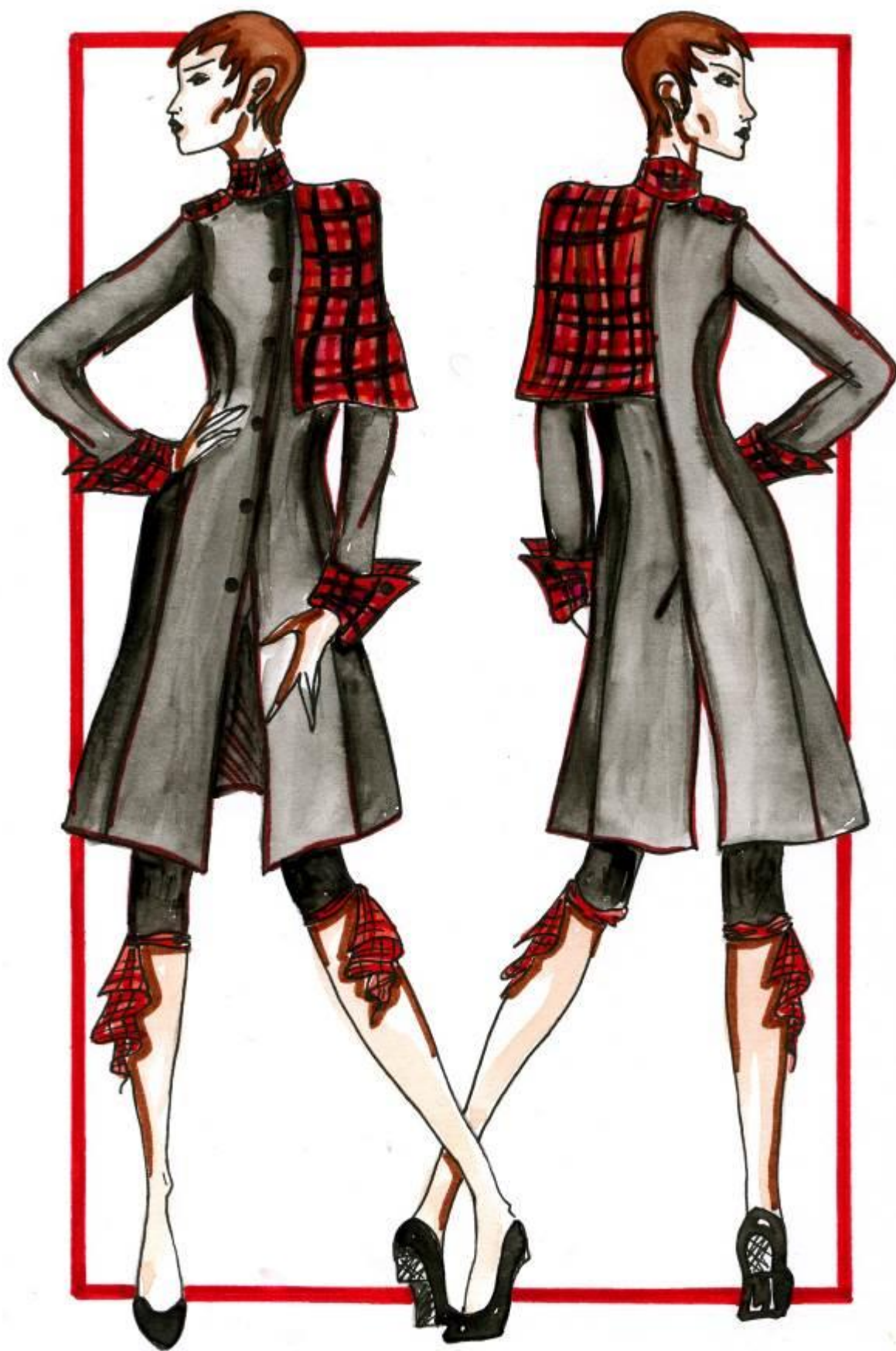
Модель № 2.