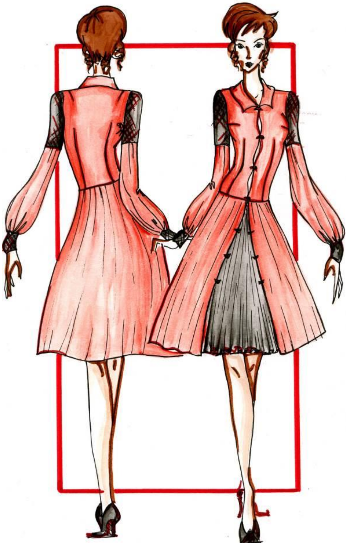
Модель № 8