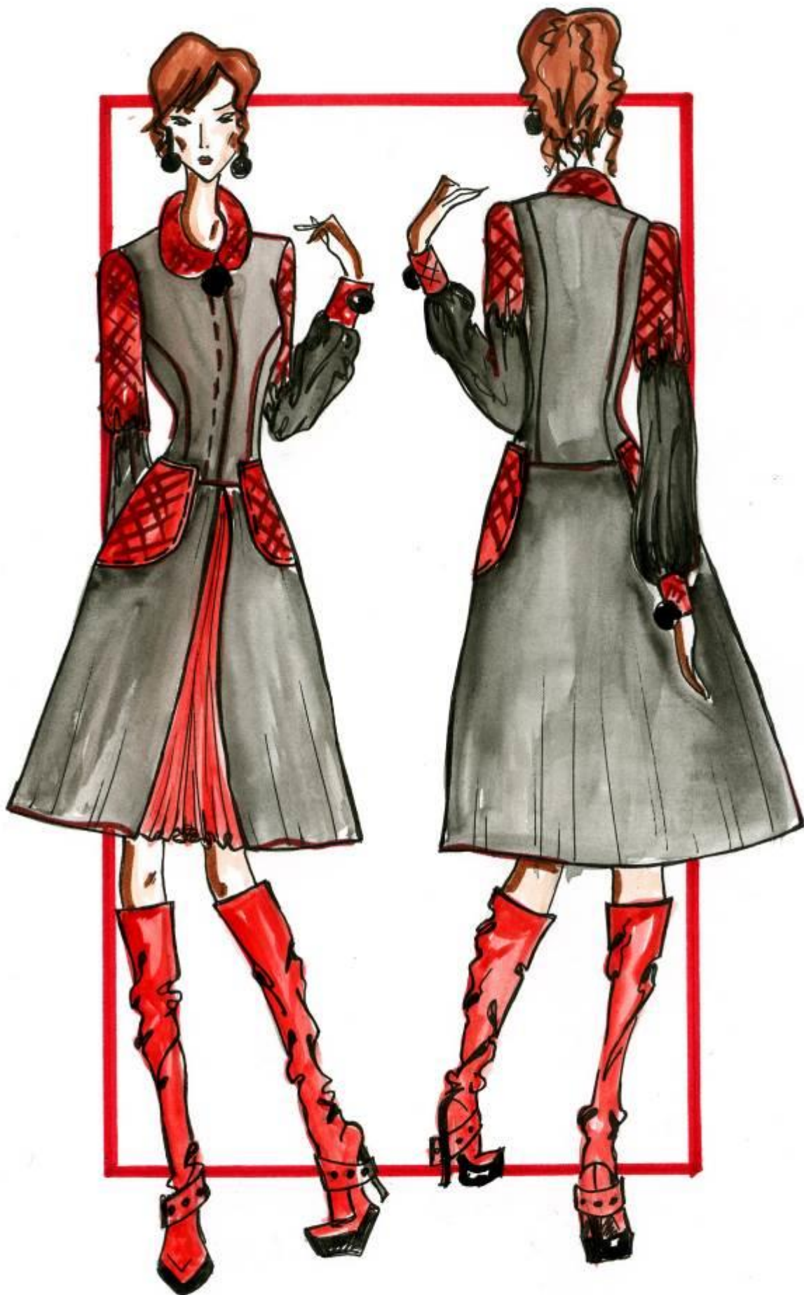
Модель № 9.