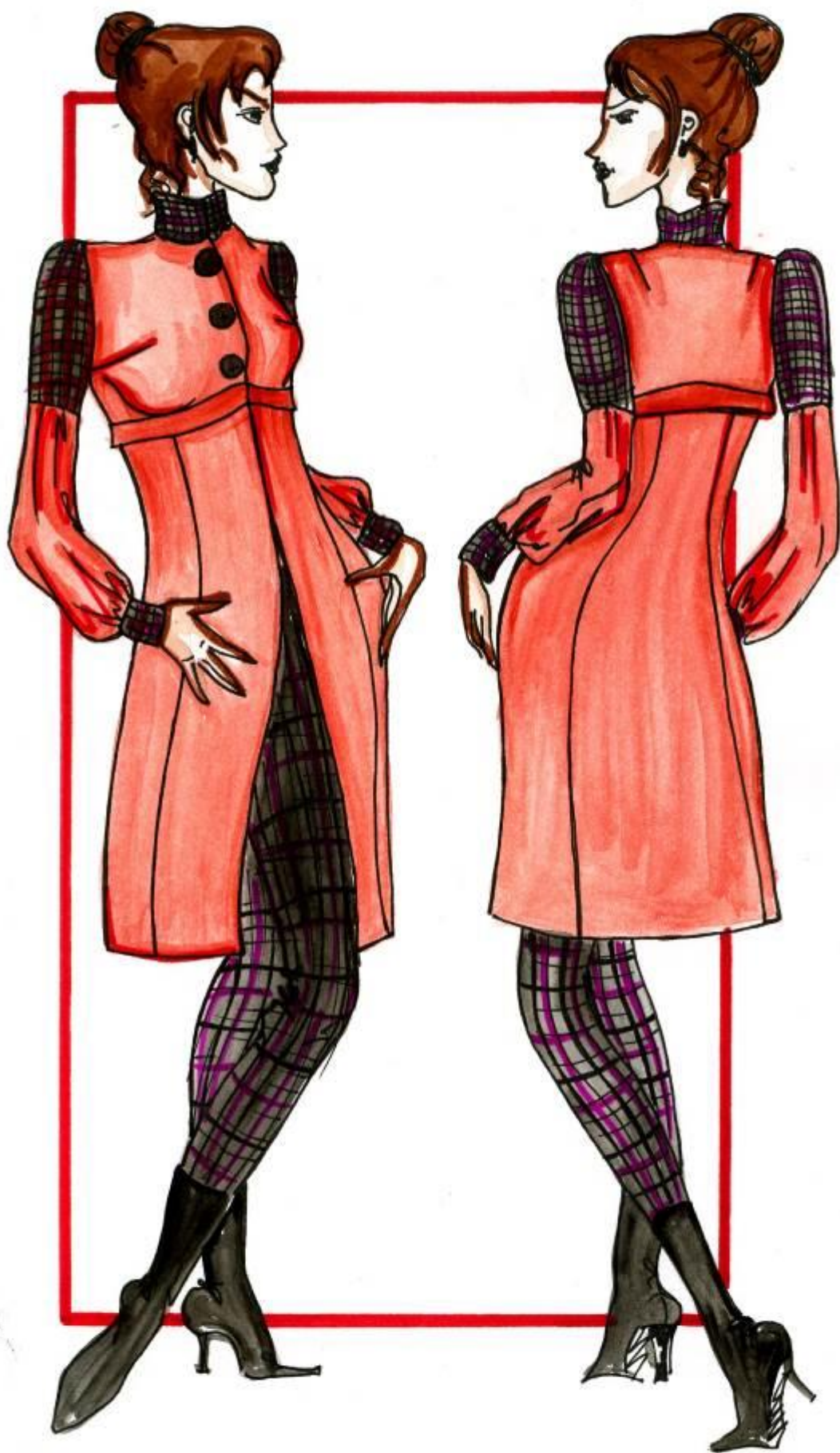
Модель № 11.