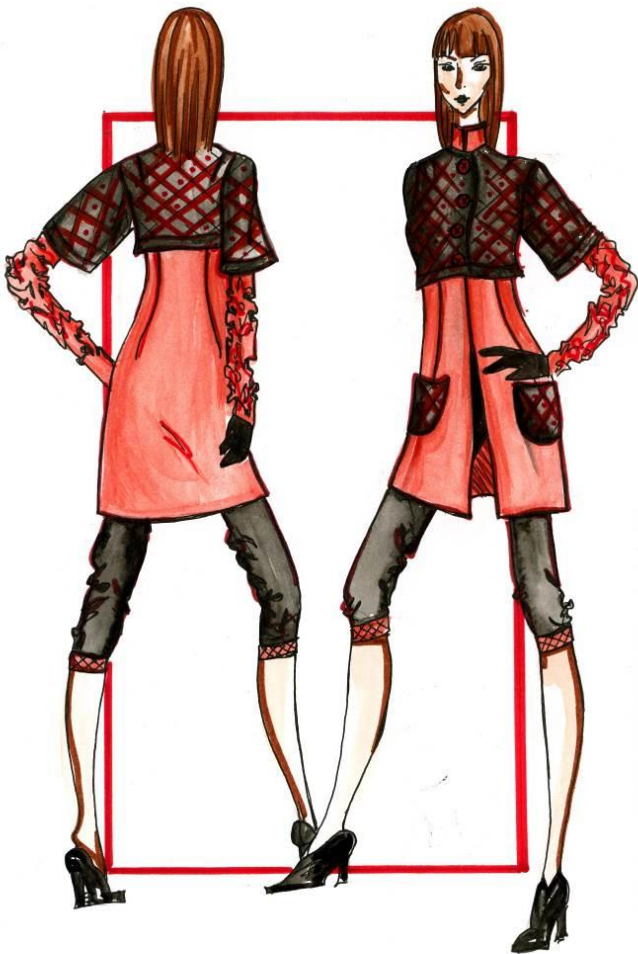
Модель N° 10