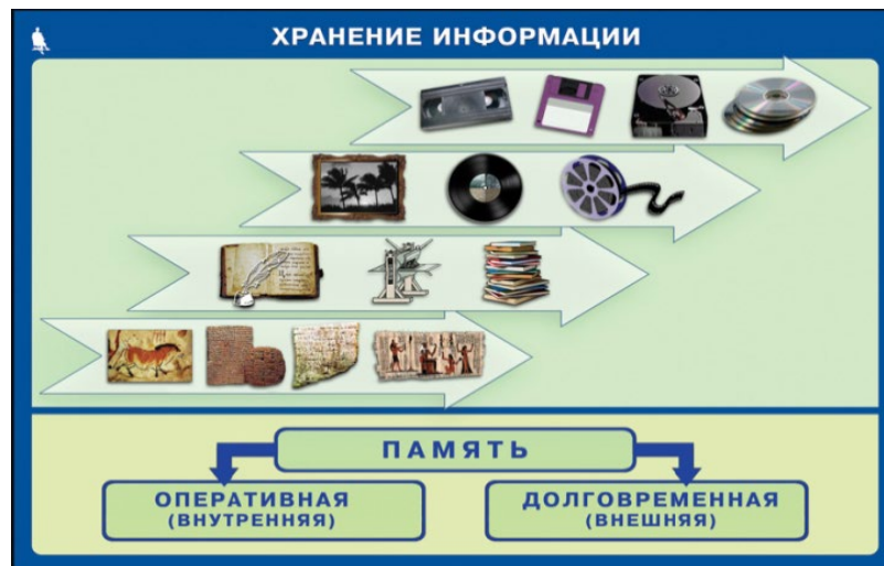
Рисунок 2 – Инфографика на тему «Хранение информации»

Задание 3. С помощью цифровых технологий разработать инфографику по теме «Хранение информации».