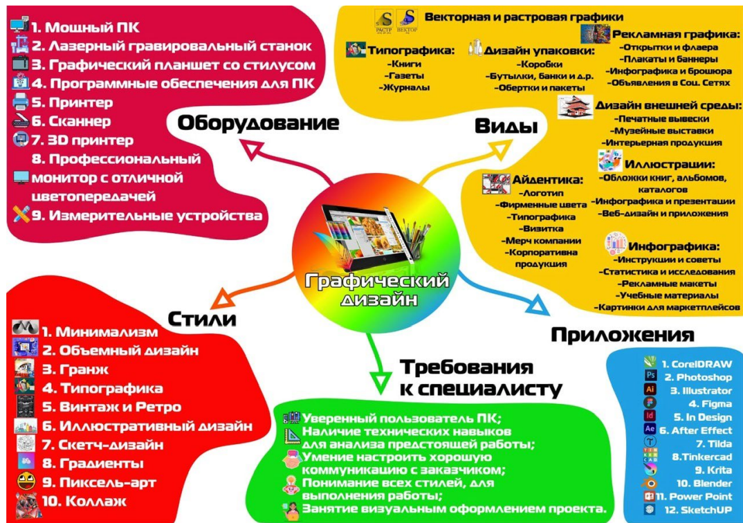
Рисунок 1 – Электронная интеллект карта на тему «Графический дизайн»

Задание 3. С помощью цифровых технологий разработать инфографику по теме «Хранение информации».