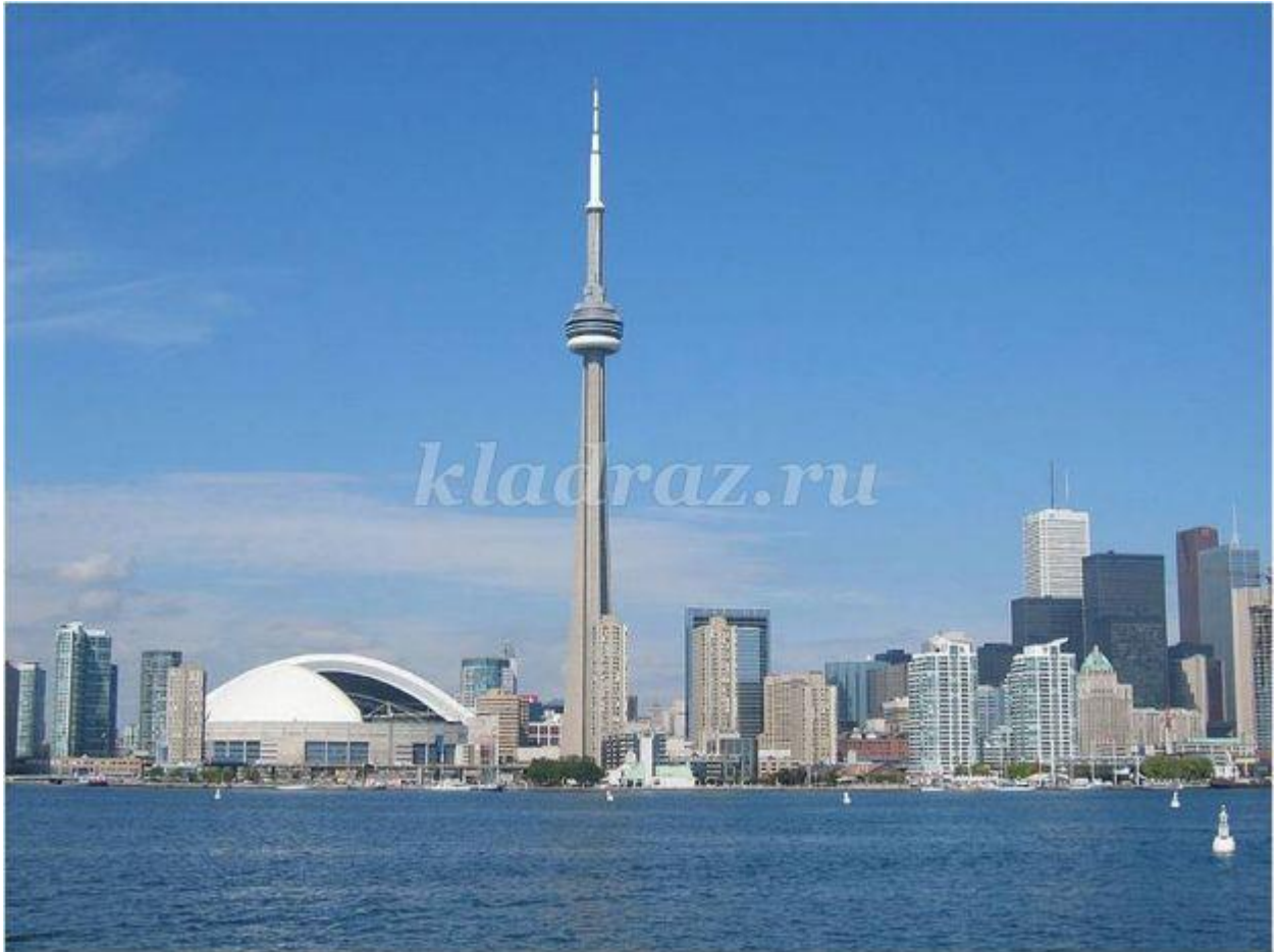
2. What is there in the picture? ( The Royal Ontario Museum, Canada )