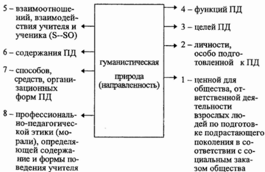
Рис. 8. Работа со схемой "Гуманистическая природа педагогической деятельности".

Рассмотрим также компоненты педагогической системы (схема В.П. Симонова) с гуманистических позиций.