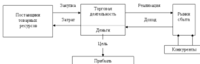
Рисунок 1 – Модель процесса организации коммерческой деятельности на предприятии

Задание 2. На рисунке 1 представлена модель процесс организации коммерческой деятельности предприятия. На ее основе постройте модели для следующих инфраструктурных элементов: биржа, осуществляющая торговлю нефтью; салон красоты; рекламное агентство.